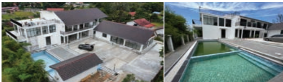
JENDERAM HILL VILLAS, Jenderam