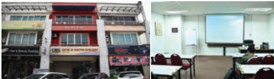
CME SDN BHD, Klang