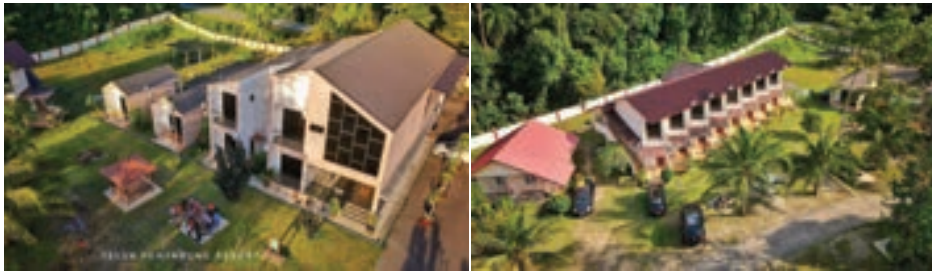
TELUK PENYABUNG RESORT, Mersing